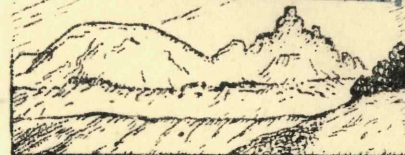
Cetatea Ciceului-Scmeș (1484)

„UNIUNEA SOMEȘENILOR” BUCUREȘTI. — CALEA MOȘILOR No. 128 PERSOANA JURIDICA INREG. LA No. 49/943 TRIB. ILFOV TELEFON 4.39.61 — 3-83-33